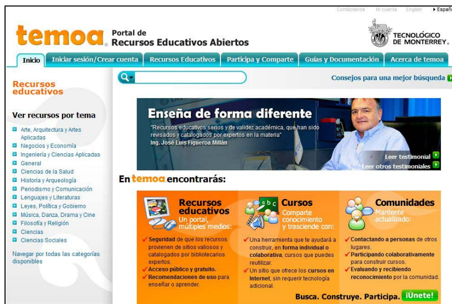
Figura 2. Portal de Recursos Educativos Abiertos (Temoa, 2010)

El portal de Recursos Educativos Abiertos temoa ® busca indizar la mayor cantidad de materiales educativos de todo el mundo y de muy distintas fuentes a través de una categorización de sitios web que proveen de REA en sí mismos (Temoa, 2010). Tal es el caso de fuentes académicas de distintas instituciones de educación superior que publican cursos completos (OCWC, 2010; OLI, 2010; OYC, 2010; NPTEL, 2010), así como de organizaciones de la iniciativa privada, entidades gubernamentales, centros de información, entidades digitales dedicadas a la divulgación de conocimiento y organizaciones sin fines de lucro. El portal pudiera considerarse un “distribuidor de conocimiento” a través de su catálogo de REA.